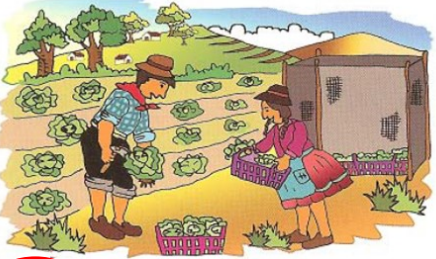
ຈັດການກັບຜະລິດຕະພັນຢ່າງລະມັດລະວັງໂດຍບໍ່ໃຫ້ ບວມຊ້າ

ສ່ວນຫຼາຍອາຍຸການເກັບກ່ຽວຂອງໝາກແຕງກວາປະມານ 30-45 ວັນ ທັງນີ້ກໍ່ຂຶ້ນຢູ່ກັບແຕ່ລະສາຍພັນ. ການເກັບກ່ຽວແມ່ນເກັບໝາກທີ່ສີຂຽວສົດເກັບທຸກວັນ ແລະ ເກັບຈົນກວ່າໝາກ